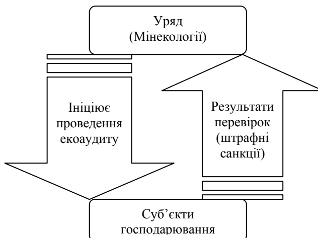
Рис. 1. Особливість запровадження екоаудиту в Україні

На даному етапі питання з формування теоретико-методологічних, організаційних та економічних основ екологічного аудиту були розглянуті в роботах таких вітчизняних і зарубіжних вчених, як Г.П. Серов, В.Я. Шевчук, Ю.М. Саталкін, В.М. Навроцький, Л.Ф. Кожушко та інших. Так, найчастіше під екологічним аудитом розуміють об'єктивний, незалежний аналіз, оцінку та розробку рекомендацій, щодо певної (екологічної, природоохоронної, ресурсозберігаючої) сторони діяльності підприємства.